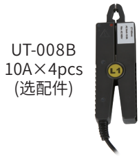
UT-008B 10A×4pcs (选配件)